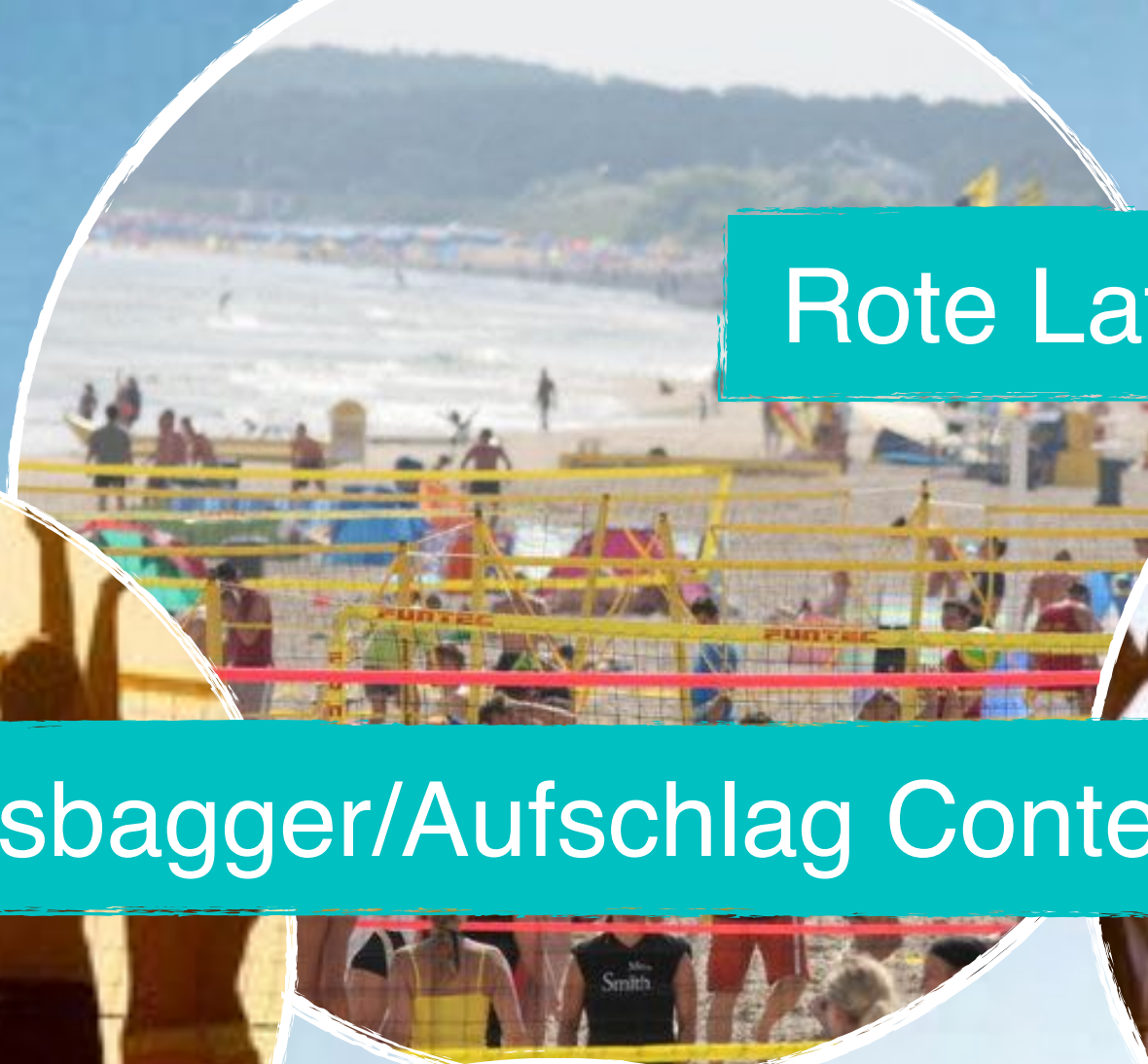
Rote Laterne Turnier